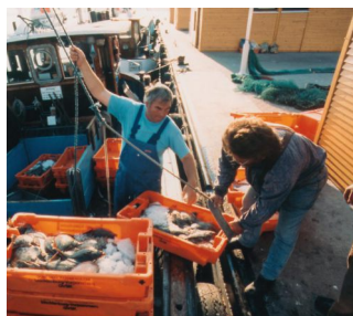
Skrzynki na ryby w zastosowaniu