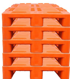
Palety w sztaplu