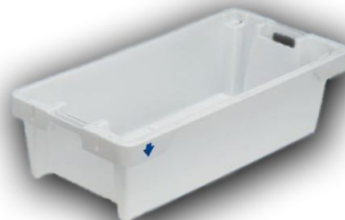
Euro-Skrzynka na ryby 25 kg / 40l