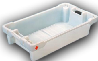
Skrzynka na ryby 20 kg / 35l