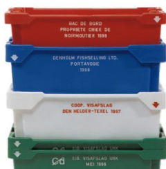
Skrzynka na ryby 20 kg/40 kg w sztaplu