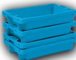
Skrzynka na filety