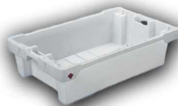
Skrzynka na ryby 50 kg / 75l