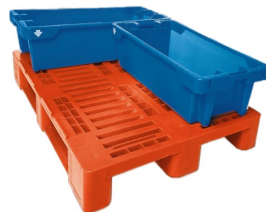
Doskonale współpracuje z Euroskrzynkami na ryby