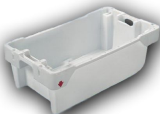
Skrzynka na ryby 40 kg / 60l